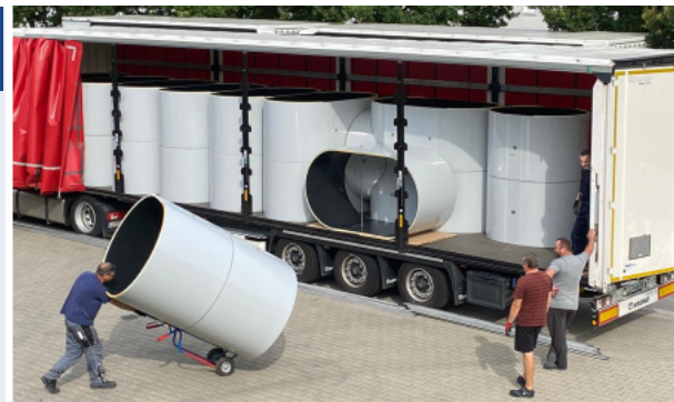
Große Dimensionen, Sonderbauteile: Dieser VENTAFLEX®-Auftrag füllt 4 x 15 Lademeter unserer Spedition